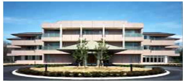
新型 特別養護老人ホーム 「恒幸園」