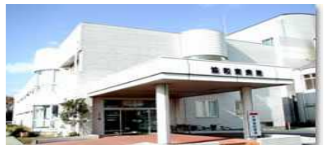
療養病床 協和南病院