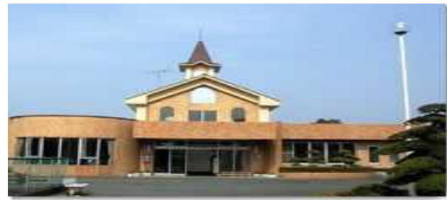
指定障害者支援施設 「董授園」