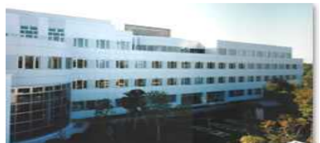
健康医学管理センター