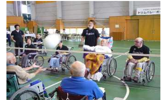
トリムバレー（日中活動）