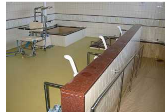
リフト浴槽・一般浴槽