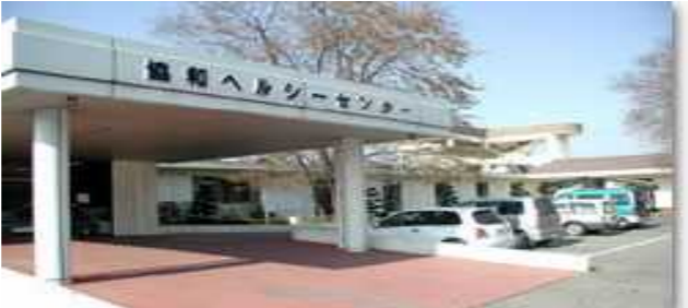
介護老人保健施設「協和ヘルシーセンター」