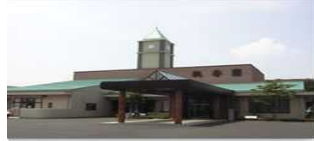
指定障害者支援施設 「桃香園」